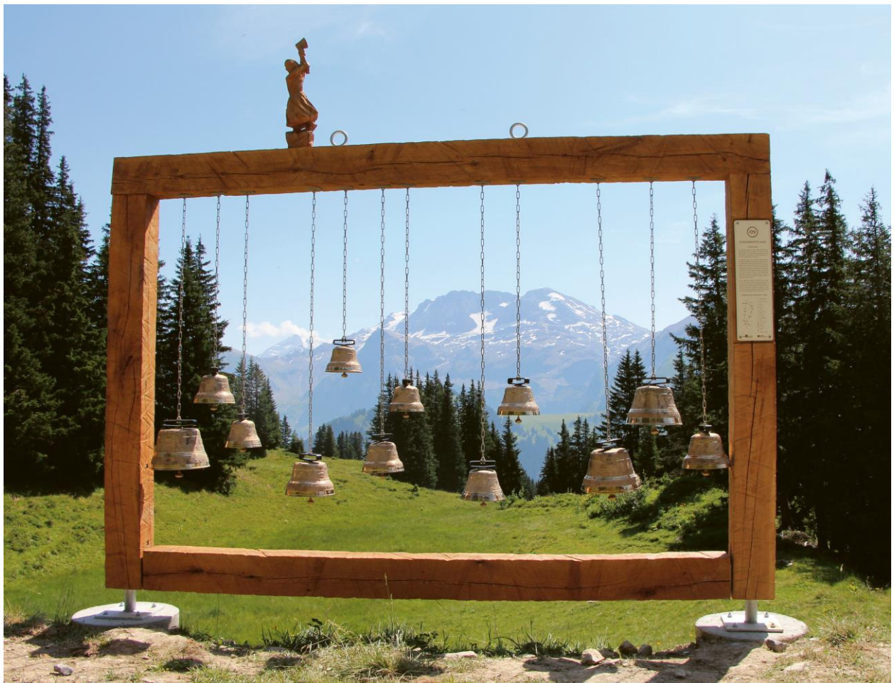
Bild aus dem Programmheft der Jährlichen Konferenz, 14. – 18. Juni 2023